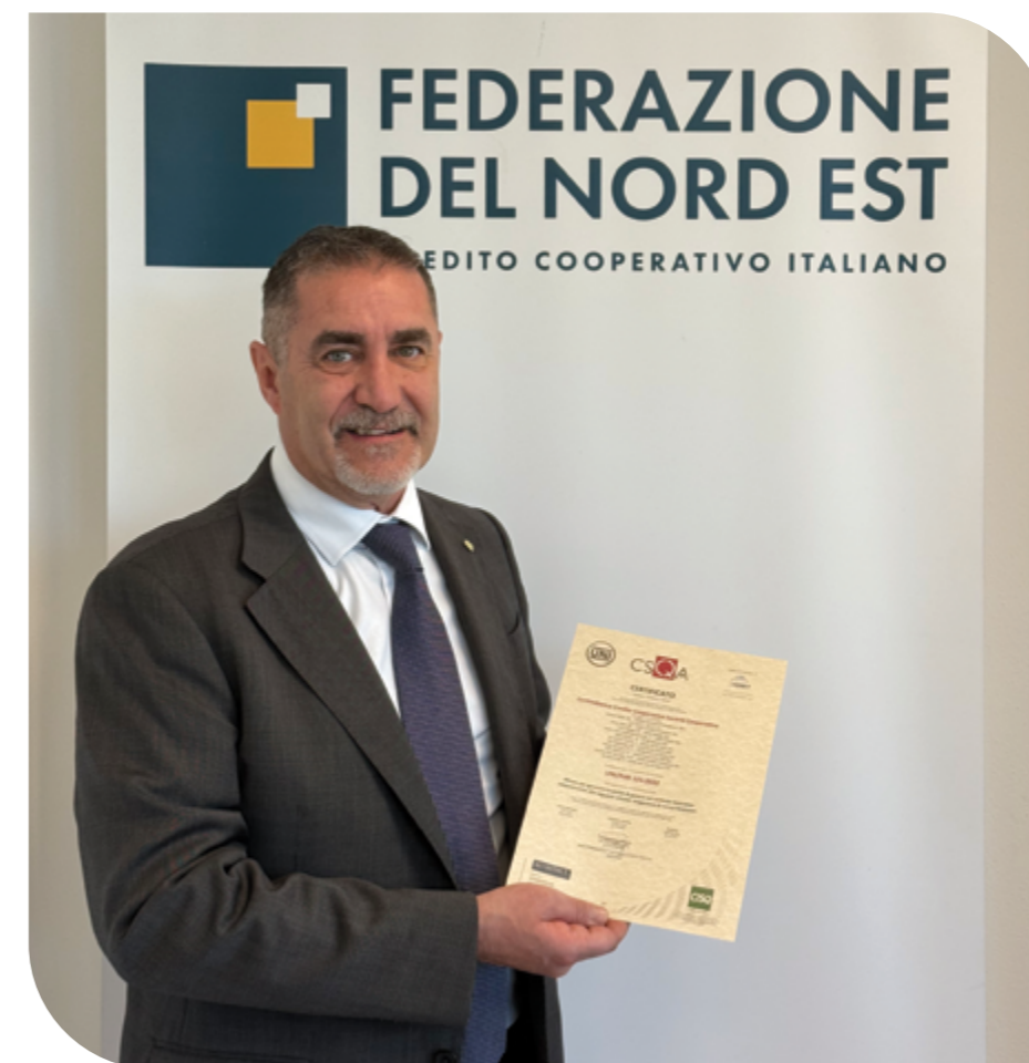
il Presidente di CORTINABANCA con la certificazione per la parità di genere

Nel 2025 CORTINABANCA ha mantenuto la certificazione per la parità di genere (c.d. Certificazione UNI PDR 125:2022 per la parità di genere ), ottenuta nel 2024 in ottemperanza alla legge 162/2021. Si tratta di un riconoscimento importante, che conferma la volontà della Banca di promuovere un ambiente di lavoro inclusivo e aperto ai valori e alle diversità, che garantisca pari opportunità a tutti i livelli. CORTINABANCA è una Banca di persone e con tale certificazione ha ribadito la volontà di continuare con un approccio che mette al centro gli individui.