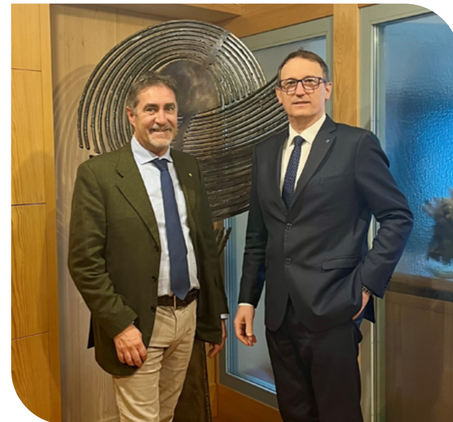
il Presidente e il Direttore di CORTINABANCA

Proprio in riferimento alla valorizzazione delle risorse umane, nel mese di marzo 2025 si è tenuta a Venezia la Convention Aziendale di CORTINABANCA, un'occasione importante – fortemente voluta dal nuovo Direttore - per incontrarsi di persona e per condividere i fondamenti della nuova fase direzionale della Banca.